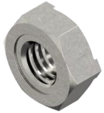
Écrous à souder