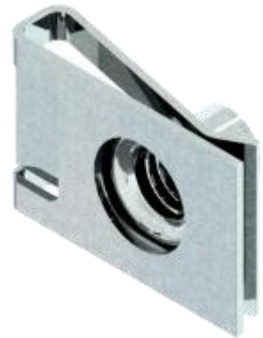
Écrous à pincer et écrous cage