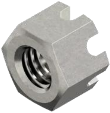
Écrous à créneaux