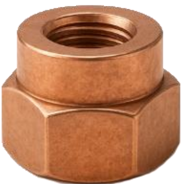
Écrous pour brides d'échappement