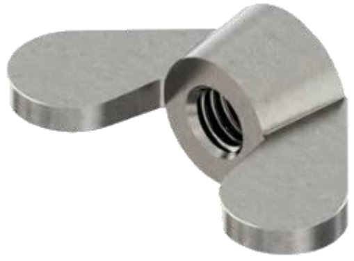
Écrous à oreilles