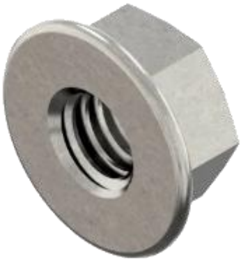
Écrous à embase